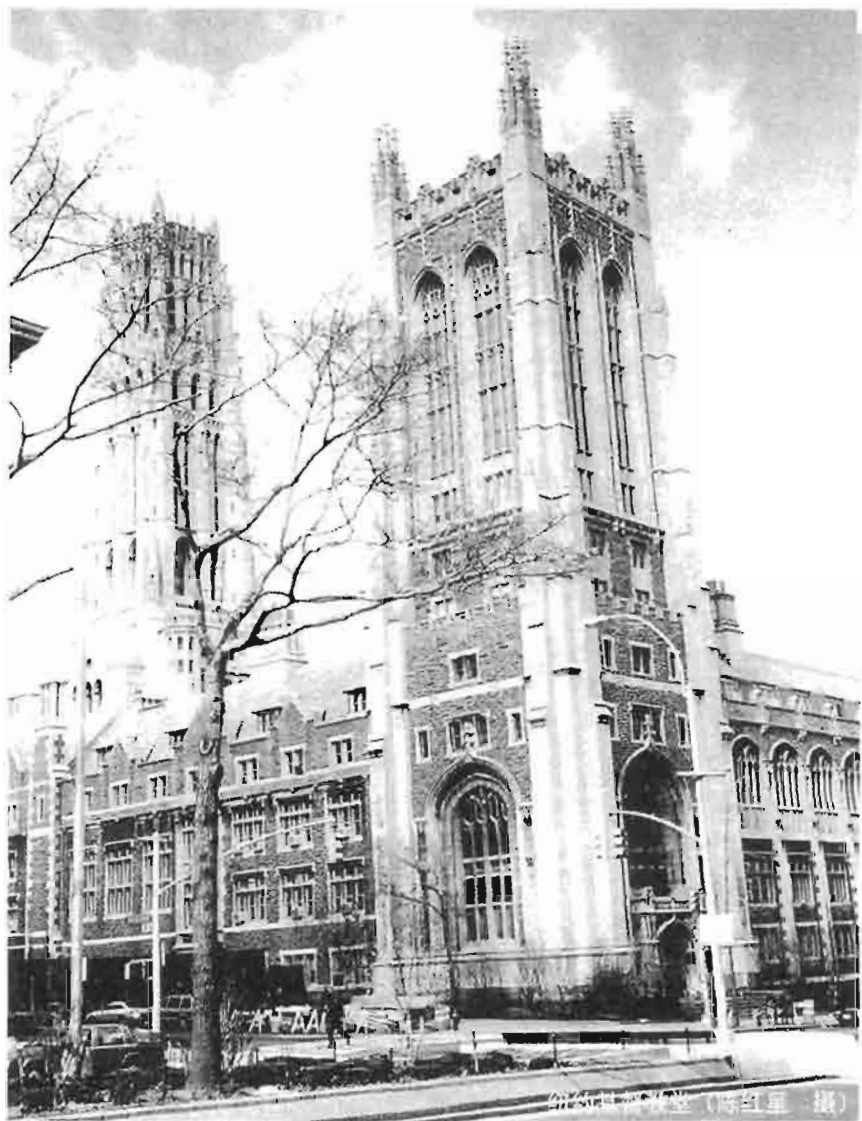
图1-1-1 教堂 (陈红军 摄)

楚地显明,在北美华人中,信徒最多的是基督教,大约有25-30%;其次是佛教,大约有10-20%;再其次是天主教,有5%左右。另外,在众多声称自己没有宗教的人中,很多人实际上持有中国某些传统民间信仰,或者参与新兴宗教的实践。对于各个宗教以及准宗教信仰实践情况的深入表述和分析,尚需另文探讨。(作者为宗教社会学博士,美国宗教社会学学会理事,从事宗教社会学的研究和教学)